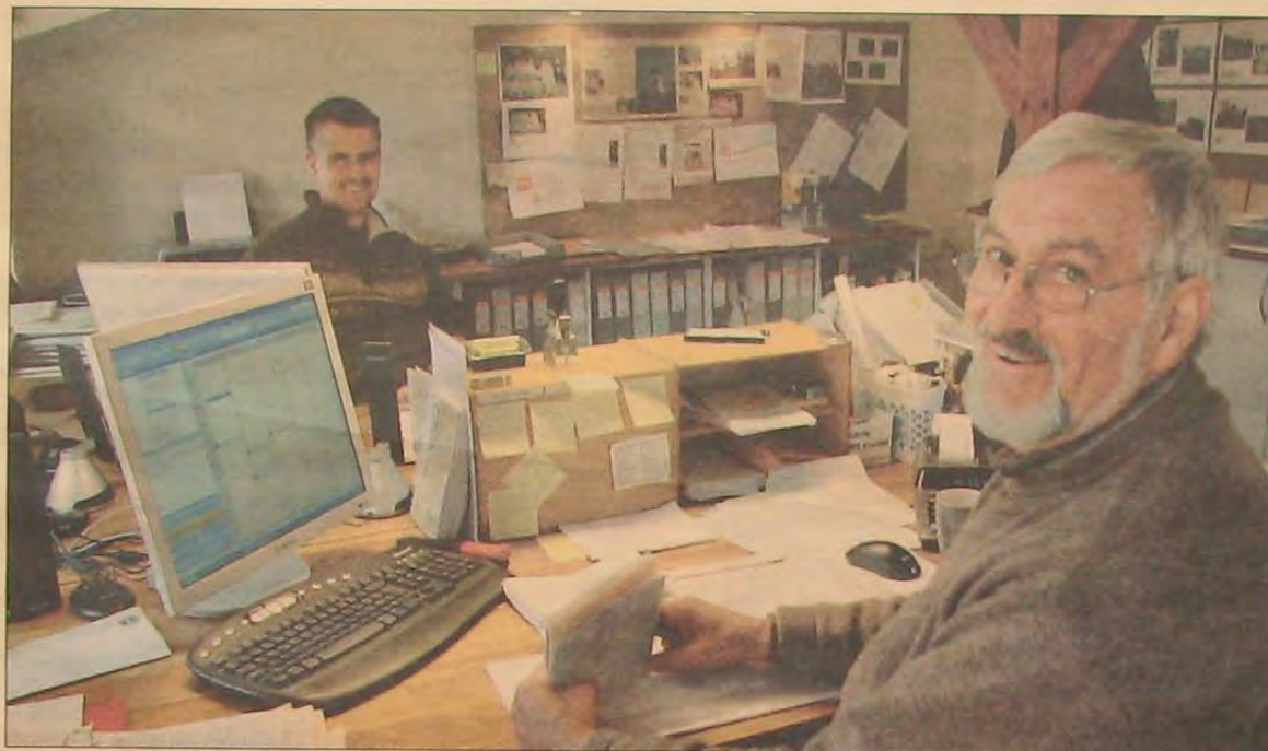
Fra kontoret på 1. sal styrer far og søn det administrative arbejde, bl. a. 14 medarbejdere.

Det gælder alt træarbejde på forskellige møbler, både den i Sønderborg ved slottet,