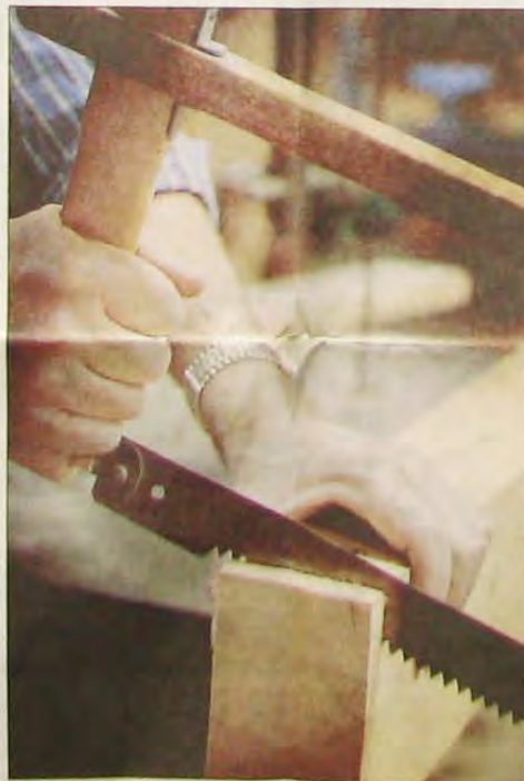
Forretningen begyndte egentlig som vognmagerforretning. Men i dag, hvor der jo ikke er så mange træhjul tilbage, er det gået over til snedker- og tømrerarbejde. Firmaet klarer alle opgaver, men har specialiseret sig i renoveringer af gamle bygninger som kirker og møller.

Hans storebror har aldrig været interesseret i at føre firmaet videre. Han er nemlig al-