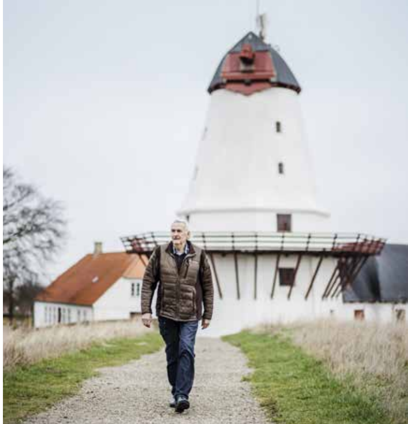
De 22 meter lange vinger hører til på Dybbøl Mølle og bliver sat i stand i anledningen af 100-året for genforeningen.

rig mobiltelefon, der må have fyldt godt op i lommen.